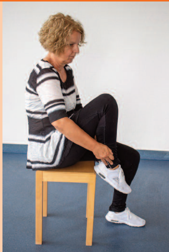
Nicht mehr als 90° beugen