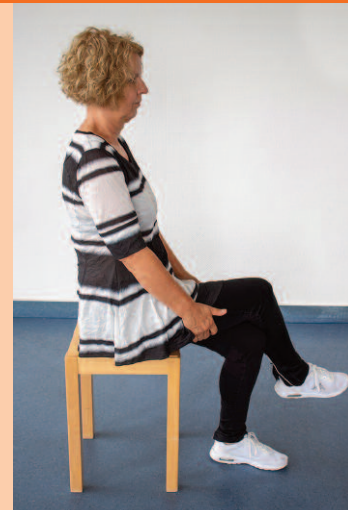
Keine Bewegung über die Körpermitte