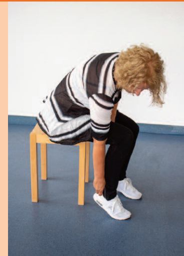
Keine Drehung nach Innen